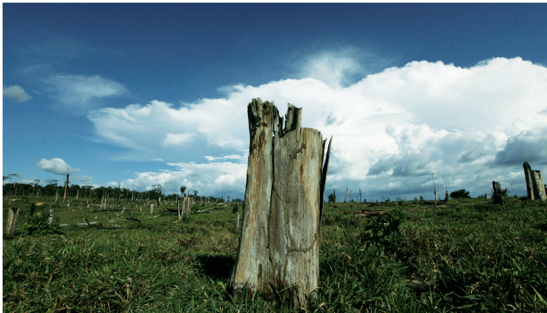
Un tronco d'albero: ciò che resta di un pezzo di foresta amazzonica dopo il disboscamento operato da un'azienda di legname a Trairão, nello Stato brasiliano di Pará

L'intervista. L'eco di un monito che scuote l'America Latina, dove le risorse naturali sono oggetto di sfruttamento selvaggio e la deforestazione minaccia il suo polmone verde